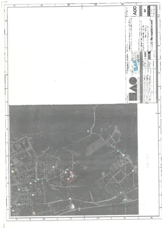
Planșa nr. 1 – Plan de încadrare în zonă